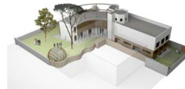
CENTRO DE ESTUDIO E INVESTIGACION. TERAPIAS ORIENTALES. ESCUELA NEIJING. Alicante 2016