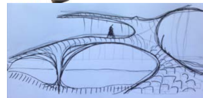
PUENTE DE MADERA. Shaxi. Yunnan. China. 2013